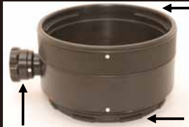
マニュアルフォーカスノブ

使用レンズのバリエーションを広げる延長リングです。長さ 60mm と 70mm からお選び頂けます。 SEA&SEA 製 MDX (NX) ポートや Athena 製 SS マウントのポート取り付けが可能になり、使用レンズのバリエーションを広げます。